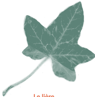
Le lière, latin : Hedera helix picard : du hière