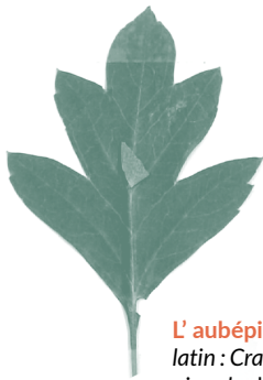
L' aubépine à un style, latin : Crataegus monogyna picard : chl'épène blanche