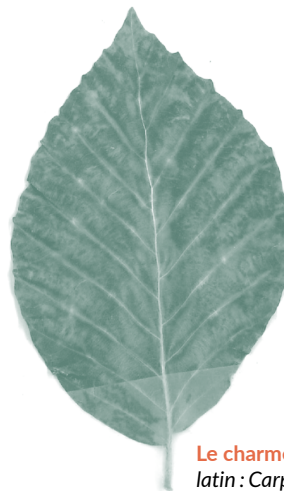
Le charme, latin : Carpinus betulus picard : chl'hétresse