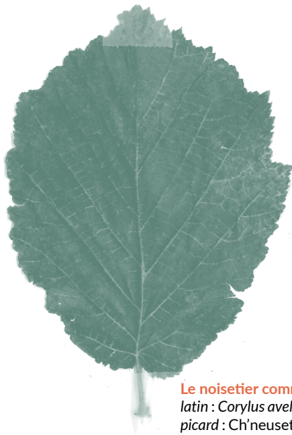
Le noisetier commun, latin : Corylus avellana picard : Ch'neusetier / ch'bos d'tcheude