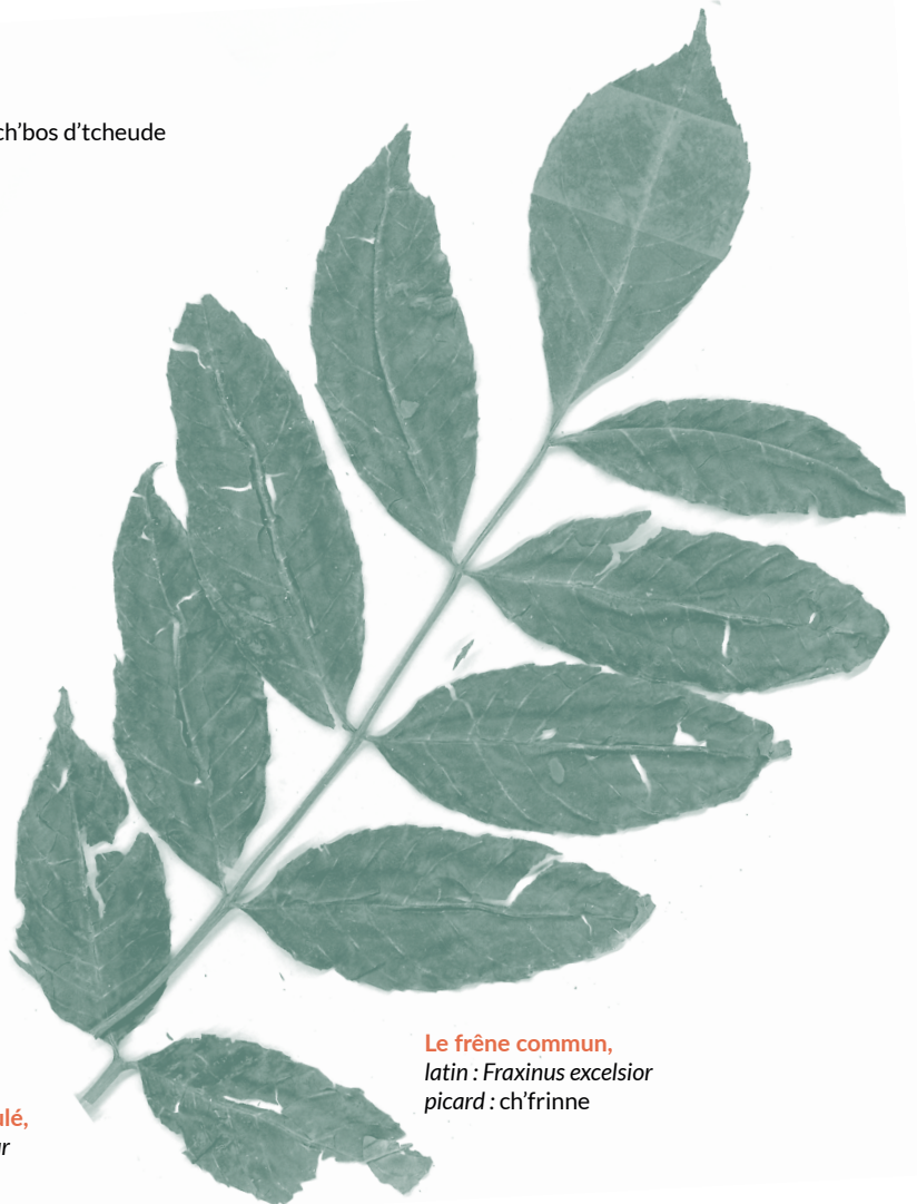
Le frêne commun, latin : Fraxinus excelsior picard : ch'frinne

Cette liste d'espèces présentes dans les haies est non exhaustive, on pourrait ajouter :