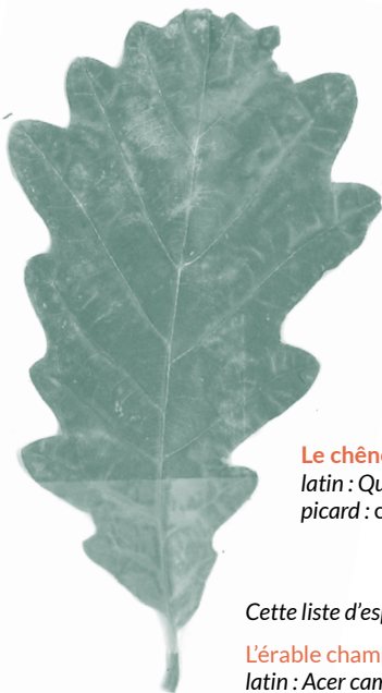
Le chêne pédonculé, latin : Quercus robur picard : ch'tchéne