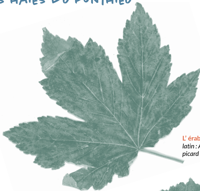
L'érable sycomore, latin : Acer pseudoplatanus picard : ch'platane