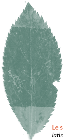
Le sureau noir, latin : Sambucus nigra picard : ch'séhu / ch'séhur