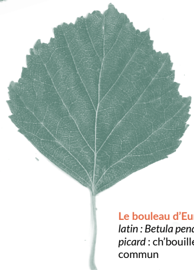
Le bouleau d'Europe, latin : Betula pendula picard : ch'bouillet commun